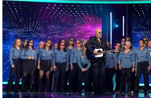
Pascal Obispo accompagné de la chorale Optic 2000

Au siège d'Optic 2000 à Clamart (92), les collaborateurs ont eux aussi pris part à cet élan de générosité national avec un petit déjeuner solidaire et une tombola, ainsi que la chorale en direct du plateau Téléthon sur France 2 , aux côtés de Santa, marraine de l'édition 2025, et de Pascal Obispo.